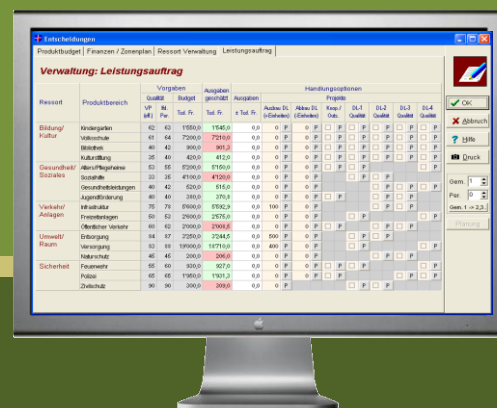
Entscheidungsparameter Produktbudget (Gemeinderat)